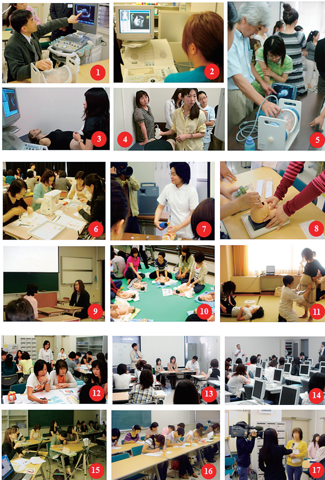
図2 育成プログラムの実際

1. 4D超音波検査の演習 2. 産科超音波検査シミュレーション装置による自己学習 3. 母体モデルなので、気兼ねなく練習可能 4. 助産師と助産学生がともに学ぶ 5. 携帯用の超音波装置での演習 6. 死産の子どものための小さな服や帽子の作製 7. 新生児の挿管の演習 8. 挿管介助の演習 9. 模擬相談者へのカウンセリング演習 10. ベビーマッサージ指導の演習 11. 骨盤計測 12. 「妊娠中からの虐待防止」でのグループワーク 13. 子育て支援の社会資源に関する講義の後に総合討論 14. 臨床スタッフも加わった生命倫理セミナー 15. e-ラーニング用のコンテンツ作成中 16. セミナー後の小テスト 17. 受講生へのテレビ取材